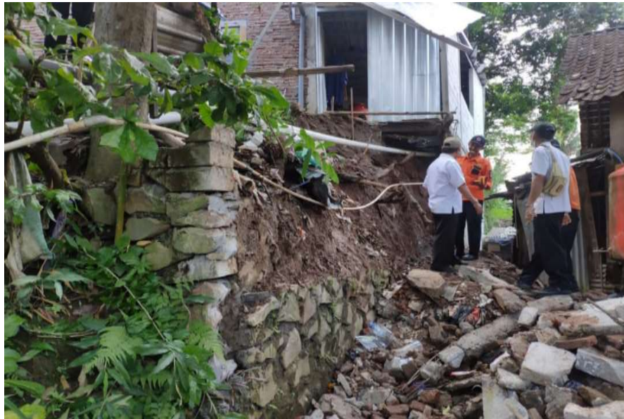
Gambar 1 : Lokasi tanah longsor di wilayah Gedawang