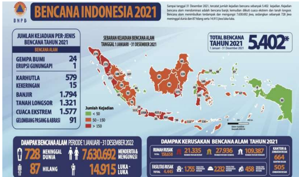
Tabel 1.1 Jumlah Kejadian Bencana di Indonesia Tahun 2021