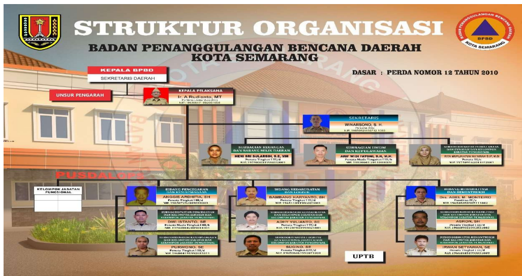
Gambar 3 : Struktur Organisasi dan Tata Kerja BPBD Kota Semarang

Bidang Rehabilitasi dan Rekonstruksi BPBD Kota Semarang berperan penting dalam memulihkan kondisi masyarakat dan infrastruktur pasca-bencana. Dengan tugas pokok yang meliputi perencanaan dan pelaksanaan program rehabilitasi dan rekonstruksi, serta fungsi-fungsi koordinasi, pengawasan, dan evaluasi, bidang ini memastikan bahwa proses pemulihan berjalan lancar, efektif, dan berkelanjutan. Melalui upaya yang terkoordinasi dan terintegrasi, Bidang Rehabilitasi dan Rekonstruksi membantu membangun kembali masyarakat yang lebih tangguh dan siap menghadapi bencana di masa depan.