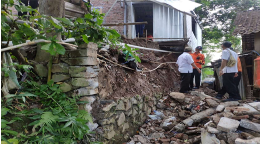
Gambar 2 : Tindakan lanjut laporan dari Aparatur Kelurahan setempat