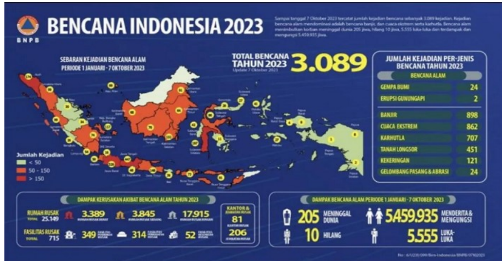
Tabel 1.3 Jumlah Kejadian Bencana di Indonesia Tahun 2023