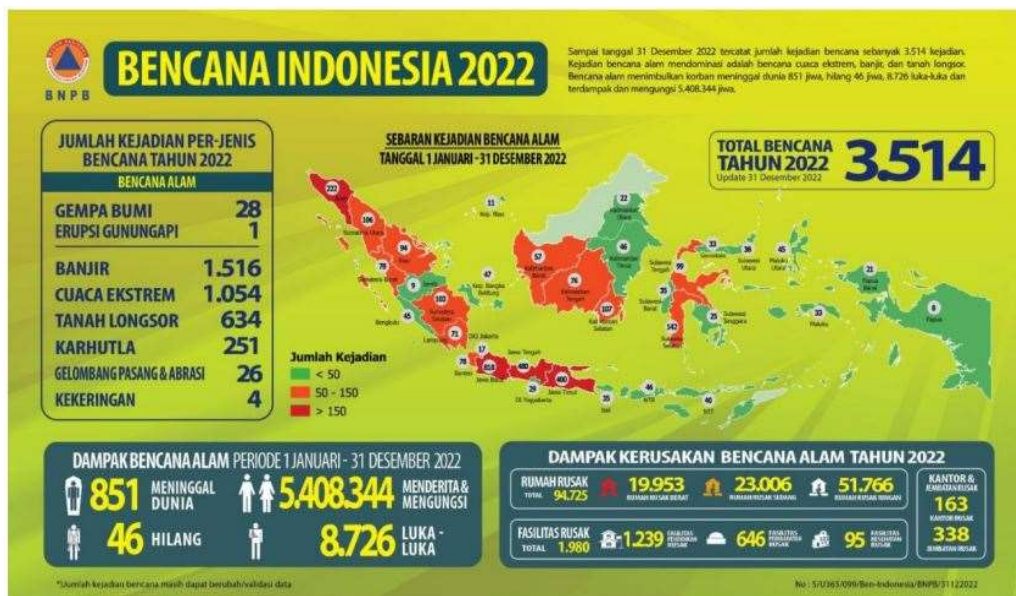
Tabel 1.2 Jumlah Kejadian Bencana di Indonesia Tahun 2022