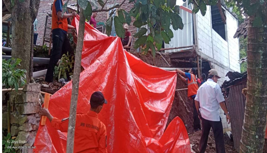
Gambar 2 : Tindaklanjut laporan dari Aparatur Kelurahan setempat

Gambar sampel situasi kejadian penanggulangan bencana yang terjadi di wilayah Kota Semarang. Metode purposive sampling dipakai guna mengumpulkan data melalui observasi dan wawancara. Guna membantu masyarakat korban bencana di Kota Semarang, sekelompok orang dipilih dari aparat pelayanan publik Penanggulangan Benvana BPBD Kota Semarang (Sugiono, 2016). Masyarakat di Kota Semarang mendapatkan pelayanan publik melalui pegawai yang bekerja di instansi BPBD.