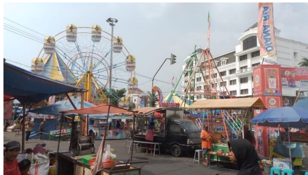
3.2 Gambar pasar rakyat

“Pasar malam (rakyat) bermakna silaturahmi antar masyarakat. Dari segi istilah orang dulu disebut dengan “megengan” yang berasal dari kata “tamu ageng” yang berarti menyambut datangnya tamu besar yaitu bulan Ramadhan atau dapat diartikan dengan mengekang nafsu. Di sisi lain juga ada nilai saling membantu (ta’awun) dalam kebaikan yaitu membantu masyarakat untuk ikut berjualan di sekitar masjid. Sehingga ekonomi mereka menjadi baik dan makmur”.