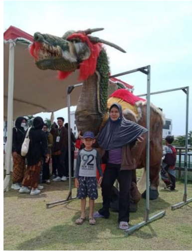
3.5 Gambar warak ngendog

Penggunaan simbol warak ngendog sebagai maskot dugderan muncul dari penjual mainan warak. Warak yang semulanya berkepala butha kemudian berubah menjadi naga karena masyarakat melihat adanya etnis tionghoa yang dapat hidup dengan harmonis. Warak ngendog juga sebagai simbol akulturasi budaya berdasarkan pertimbangan masyarakat, karena keseluruhan perupaannya mempresentasikan simbol budaya dari tiga etnis masyarakat Kota Semarang.