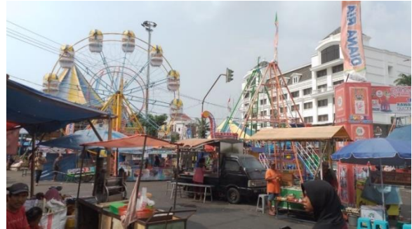
Dokumentasi Pasar Rakyat dalam dugderan