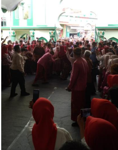
Penyambutan walikota Semarang