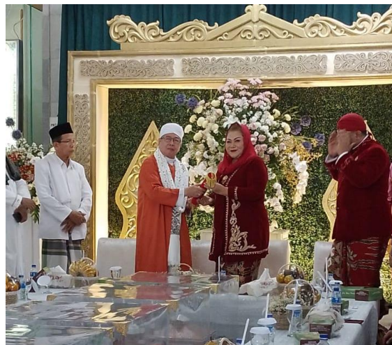
3.4 Gambar penyerahan shukhuf halaqah

“ Halaqah dan tabuh bedug bermakna dalam memutuskan suatu perkara seharus bermusyawarah (nilai musyawarah) dengan yang lainnya. Adanya perkumpulan masyarakat di Alun-alun kota bermakna silaturami dan menggambarkan keharmonisan kehidupan masyarakat dari berbagai etnis. tetenger atau pertanda dimulainya puasa dan sebagi alat komunikasi jaman dahulu. Serta meneguhkan keyakinan awal ramadan. Nilai silaturahmi juga seagai wujud akulturasi budaya seagaimana simbol warak ngendog sebagai representasi dari tiga etnis yang melebur menjadi satu dalam dugderan”.