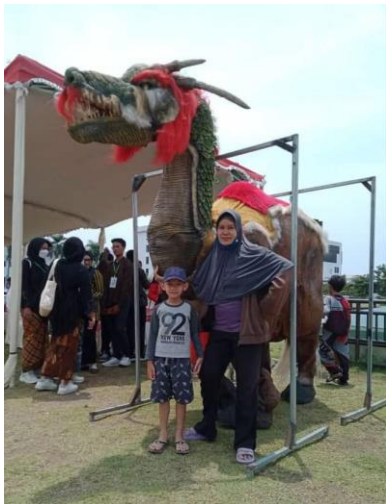
Simbol Warak Ngendog