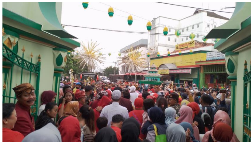
Kedatangan rombongan arak-arakan dari Walikota Semarang