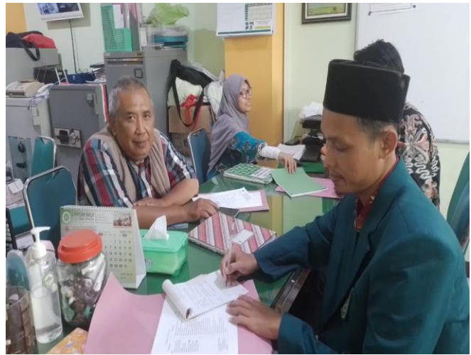
Wawancara dengan Ketua Panitia