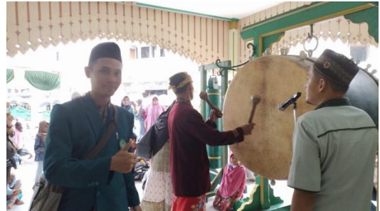
Tabuh bedug penanda awal ramadhan