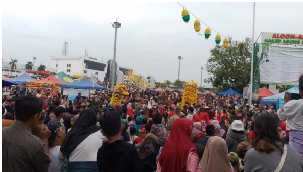
Prosesi Pengumuman awal ramadhan