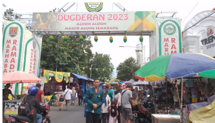
3.1 Gambar lokasi dugderan

“Ketika akan menyampaikan pengumuman tersebut, warga kumpul untuk menunggu pengumuman tersebut yang termaktub dalam suhuf halaqah . Ketika sudah disepakati maka disampaikan kepada Kanjeng Bupati untuk diumumkan. Setelah pengumuman tersebut lantas ditandai dengan pemukulan bedug di Masjid dan bunyi Meriam di Kanjengan (tempat tinggal kanjeng Bupati). Kemudian dengan bunyi tersebut menjadi istilah dugderan”.