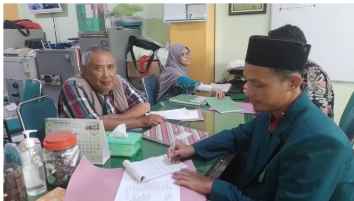
3.2 Gambar wawancara dengan panitia dugderan

Pembacaan shuhuf halaqoh ditunggu-tunggu oleh masyarakat yang berkumpul di Aloon-aloon Kauman. Berkumpulnya masyarakat membawa dampak ekonomi dengan kehadiran para penjual yang "mremo" di sekitar Aloon-aloon pada malam hari, sehingga muncul kegiatan pasar malam.