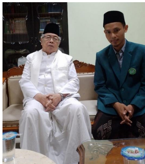
3.6 Gambar wawancara dengan tokoh ulama

Melihat sejarah perjalanan penyelenggaraan dugderan di tahun 2003–2008 berpindah-pindah yang kemudian tempatnya dikembalikan ke Masjid Agung Semarang seperti semula memberi makna akan pentingnya peran masjid bagi masyarakat agar masyarakat mengenal, mencintai, dan meramaikan (memakmurkan) masjid.”