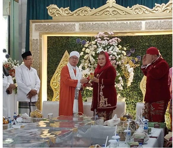
Penyerahan Sukhuf Halaqah