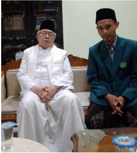
Wawancara tokoh Ulama