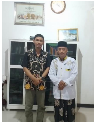
Wawancara dengan masyarakat Kota Semarang