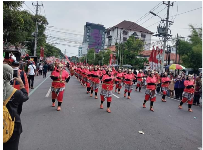
Prosesi Kirab Budaya